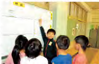
「受付はこうするんだよ」と教える上級生

校庭では、男子は「サッカー」、女子は「縄跳び」が一番人気です。高学年の子どもがサッカーのルールを教えてチーム編成をしたり、縄跳びでは、みんなで大縄に入って跳ぶ姿がみられます。また、プレイランド室では、宿題や読書、ゲームをするなど、子どもたちは思い思いに活動しています。5年生が「けん玉」をしているのを見て「すごーい」と歓声をあげる2年生がいるかと思えば、上級生に折り紙を教えてもらい嬉しそうにしている下級生もいます。胸名札を付けるのが苦手な1年生には、上級生が「こうやって付けるんだよ」と手伝ってあげています。