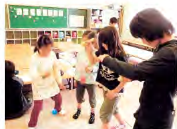
一緒に仲良く遊ぶ子どもたち

スタッフを募集している放課後子ども教室があります。詳しくは下記までご連絡ください。 問い合わせ▶公益財団法人 足立区生涯学習振興公社 放課後子ども教室担当 ☎5813・3732 (平日 午前9時~午後5時)