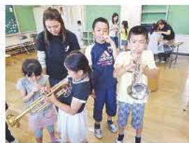
トランペットに初挑戦♪