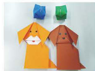
子どもたちと一緒に折る作品を学びます