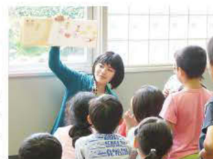
おすすめ本のお話を聞いてね

おすすめの本を紹介するお兄さん、お姉さんの話を聞き、自分が一番読みたい本に投票、今日のチャンプ本を決めるバトルです。チャンプ本には何人もの子が興味津々。早速読んで、読