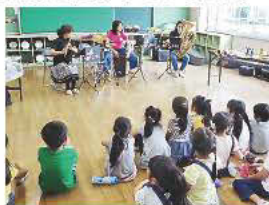
生演奏の迫りに釘づけ!

「音が出るようになったよ!」頬を膨らませて一生懸命楽器に息を吹き込む子どもたち。「ミニコンサート&楽器体験」の一コマです。足立ジュニア吹奏楽団の指導者有志による演奏の後、楽器に触れることができ、「いろいろな曲を聴けて楽器もやれて全部楽しい」「初めて触った楽器があった」など、子どもたちの笑顔がはじけます。「楽しんでる子どもたちの反応を直接感じる事ができた」と指導者も笑顔。子どもたちと音楽との新たな出会いが、放課後に広がっています。