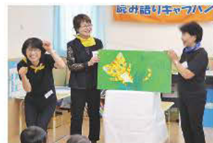
大型絵本『はじめまして』

「あだち放課後子ども教室」は区内の小中学校内で、地域の方(スタッフ)の見守りのもと子どもたちが遊びや読書など自主的に活動する場です。