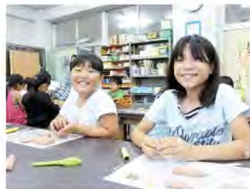
鉛筆の手作り楽しいよ！

“先生”は、生活関連用品や手づくりのための素材を販売している、株式会社東急ハンズのみなさんです。「この教室に参加したことで、エコロジーを考えるきっかけになったり、自分の手で作る楽しさや、工夫することのおもしろさを感じてもらえたりするといいですね」と話していました。参加した子どもたちは、「すごく楽しかった」と、うれしそうに話してくれました。