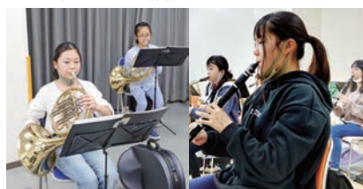
少人数に分かれてじっくり練習