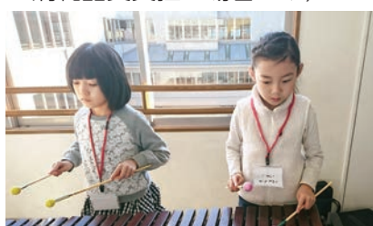
丁寧に音をたしかめて練習