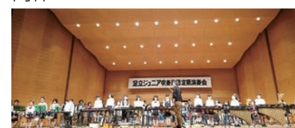
足立ジュニア吹奏楽団との合奏