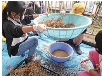
花の種をとる体験教室

園芸知識のあるスタッフが企画しました。種をとるのは校内で春先にピンクの花がたくさん咲いた「ピンクパンサー」です。子どもたちは小さな手でしっかりと種をとりました。開かれた学校づくり協議会花部の方々も、下準備にきてくださいました。