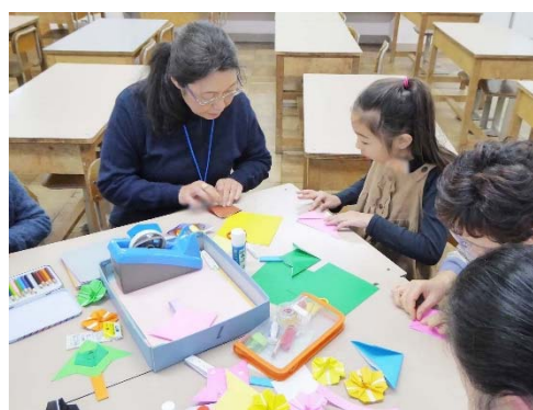
放課後子ども教室 おり紙サポーターの活動