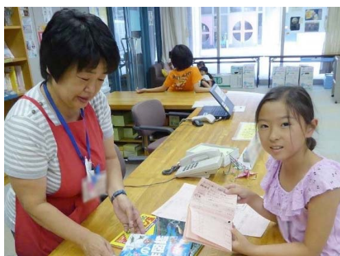
放課後子ども教室 読書の通帳