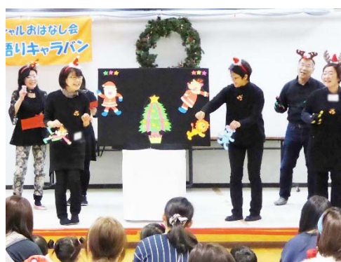
スペシャルおはなし会 読み語りキャラバン