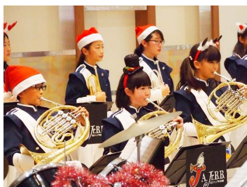
足立ジュニア吹奏楽団 クリスマスコンサート