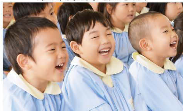
この弾ける笑顔がキャラバン隊のパワーに！

「みんなの好きな『だるまさんが』の絵本が大きくなりました！今日は大きなだるまさんも来ているよ。みんなで呼んでみよう！せーの、だるまさん！」子どもたちが大声で呼ぶと、赤い衣装を着た隊員が登場！会場は大歓声と笑い声に包まれました。