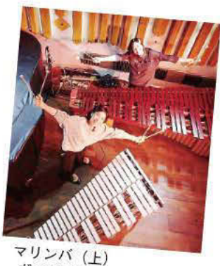
マリンバ(上) ヴィブラフォン(下)

コンサート in ミュージアムとは... 区内にある5カ所の民間施設がネットワークを結び、各施設が年1回ずつ、特徴を活かしたコンサートや催し物を行っています。芸術を心から愛する創設者の想いや、引き継がれた願いが詰まった空間での味わい深い珠玉の体験。心のぜいたくをぜひご堪能ください。