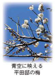
青空に映える 平田邸の梅

定員 50人(抽選) 費用 1,000円 申込方法 往復はがきに①「3/3 昭和の家」②郵便番号、住所③氏名(ふりがな)④電話番号⑤年齢を記入し、郵送。 ※重複申込不可 ※未就学児不可 ※ハガキ1枚につき1名のみ記載 締め切り 2月8日(金) 必着 ※より多くのお客様にお楽しみいただくため、平成30年度内、お一人様1回のみの当選とさせていただきます。 申し込み・問い合わせ (公財)足立区生涯学習振興公社 文化活動支援課 〒120-0034 千住5-13-5 学びピア21 4階 ☎5813-3731 平日 午前9時～午後5時