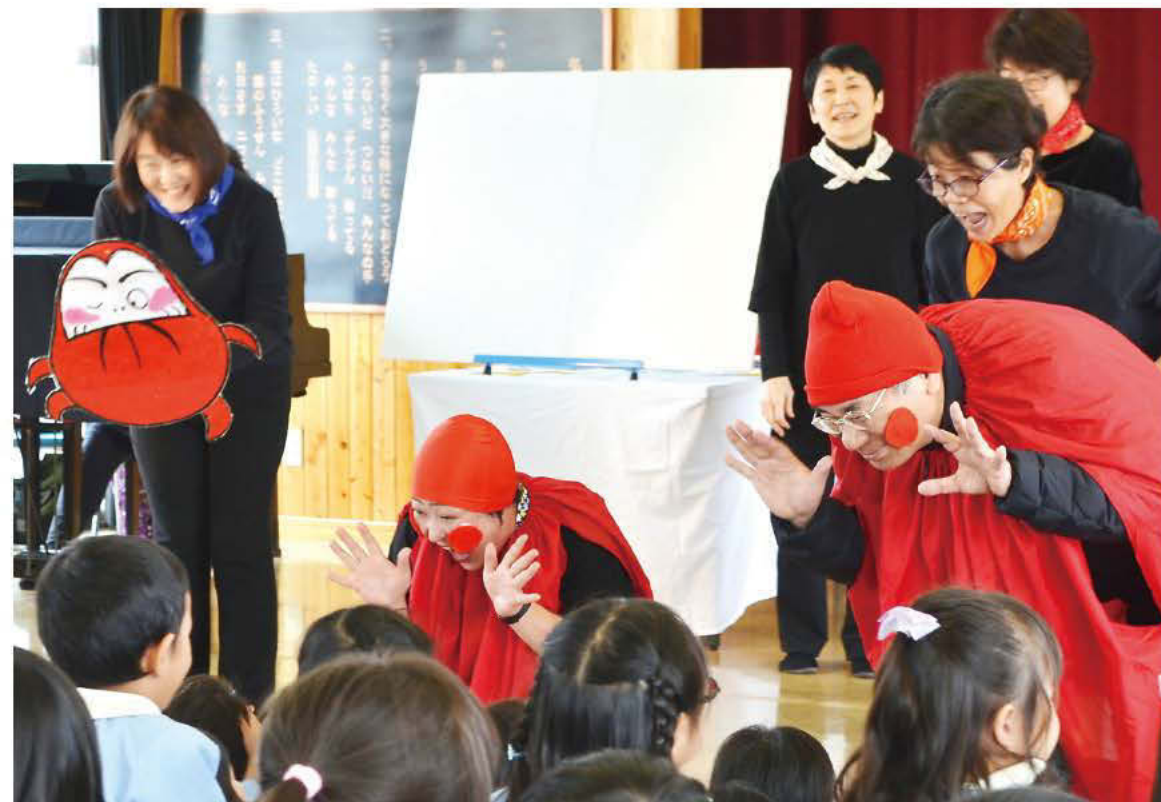
だるまになりきるキャラバン隊。子どもたちと一緒にオトナも楽しんでいます！