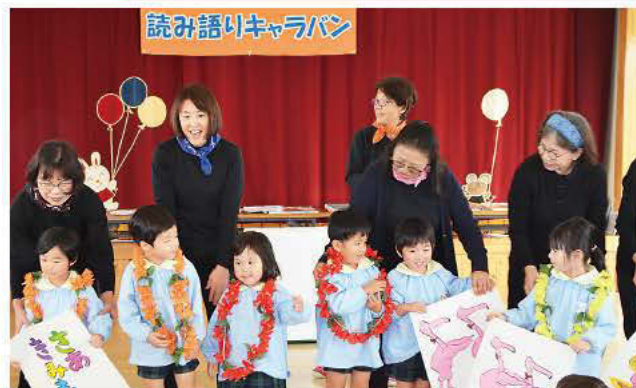
時には子どもたちも一緒におどります