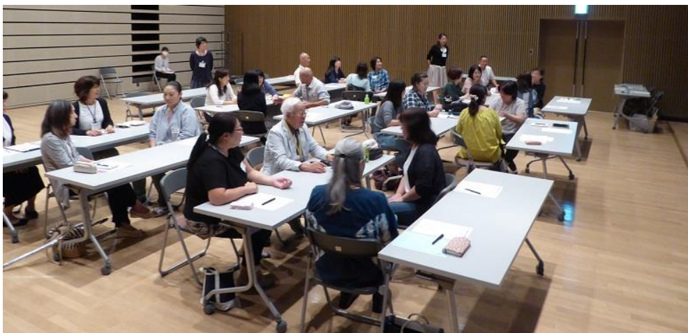
スタッフ研修Bの様子