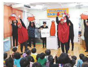
子どもたちに大人気の絵本 「だるまさんが」

「読み語りキャラバン」のプログラムは、 手作り大型絵本の読み語り、詩の朗読や歌など 内容盛りだくさん! 見て聞くだけではなく みんなで一緒に声を出したり、歌ったりしま す。