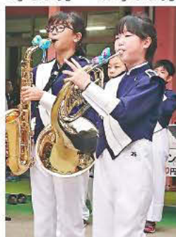
いっしょに楽しく!!演奏しよう♪

※申込用紙は各地域学習センター、 区内小学校で配布中 ※公社ホームページからもダウンロードできます