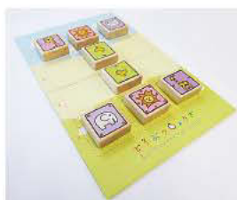
「どうぶつしょうぎ」の盤と駒

3×4マスの盤で、ライオンやゾウが描かれた8個の駒で対戦する、将棋のルールを簡略化したゲーム。各動物の駒に、進める方向を示す印がついていて、基本的なルールを学べば低学年でもすぐに楽しく遊べます。対局相手のライオンをつかまえるか、自分のライオンが相手のエリアに入ったら勝ち。8個の駒のゲームでも奥が深く、子どもたちも夢中で遊んでいます。