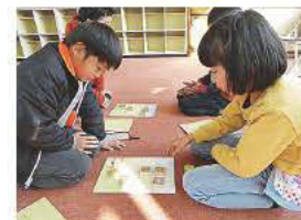
次の一手を考え中