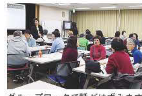
グループワークで話がはずみます