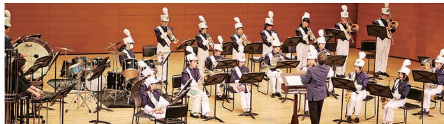
本番は立派な団服で演奏を披露！