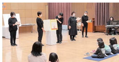
前回の様子(大型絵本)