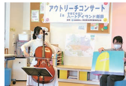
素敵な音色に癒されるひととき