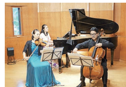
深みのある本格的なクラシックを満喫