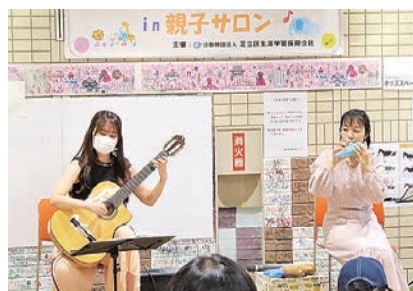
親子で感じる音楽の魅力