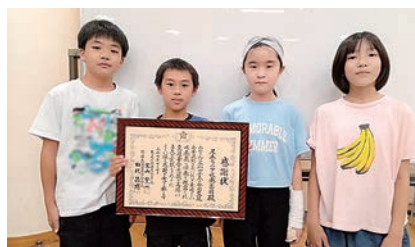
立派な賞状を頂きました!