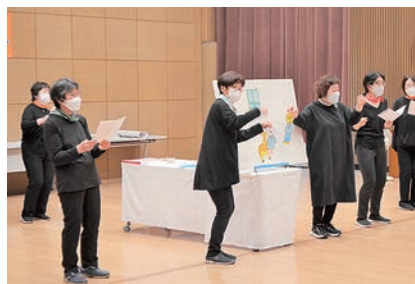
前回の様子(パネルシアター)