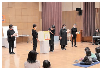
前回の様子(大型絵本)