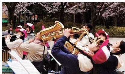
「綾瀬交通安全のつどい」演奏の様子