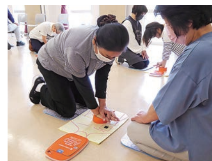
AED簡易キットで練習中

子どもたちのケガや事故に対応できるよう、応急手当や心肺蘇生法(胸骨圧迫、AED〔自動体外式除細動器〕の使用法)を学ぶ講習会です。熱中症やケガをした際の聞き取りのポイント、アイシングの方法などを習得するスタッフの姿は真剣そのもの。年に1回、知識の再確認をしています。