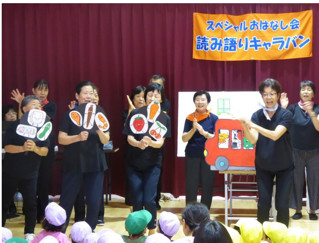
スペシャルおはなし会 読み語りキャラバン