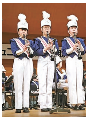
練習の成果を響かせて