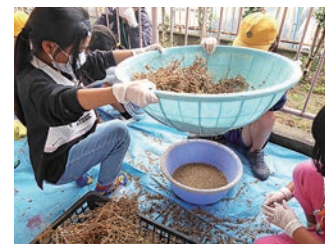
花の種をとる体験教室

園芸知識のあるスタッフが企画しました。種をとるのは校内で春先にピンクの花がたくさん咲いた「ピンクパンサー」です。子どもたちは小さな手でしっかりと種をとりました。開かれた学校づくり協議会花部の方々も、下準備にきてくださいました。