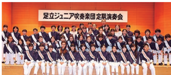
昨年の定期演奏会

曲目 ①行進曲「春」②足立ジュニア吹奏楽団結成20周年記念委嘱作品「おきなぐさ～宮澤賢治の愛でた花～」③【初演】足立ジュニア